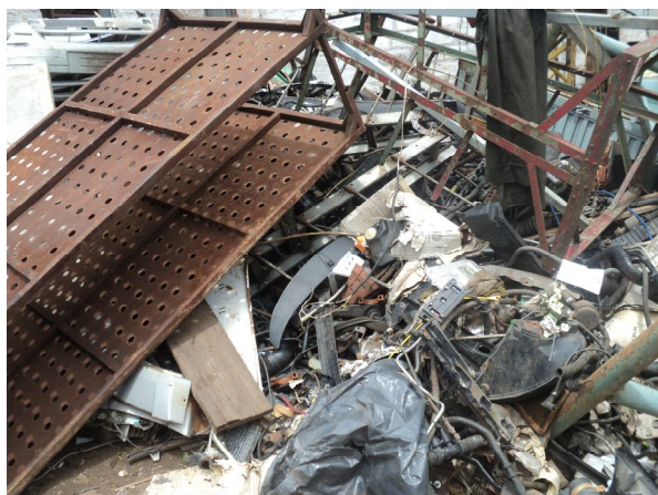
Foto 3 - Peças acondicionadas em área descoberta.