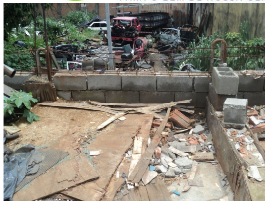
Foto 6 – Terreno situado aos fundos do empreendimento.