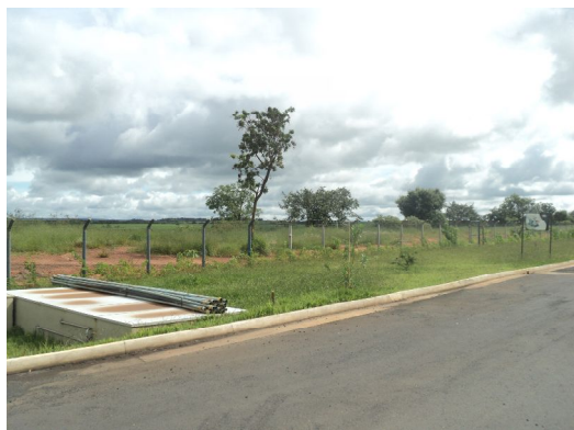
Foto 7 – Vista de uma área de frente ao empreendimento.