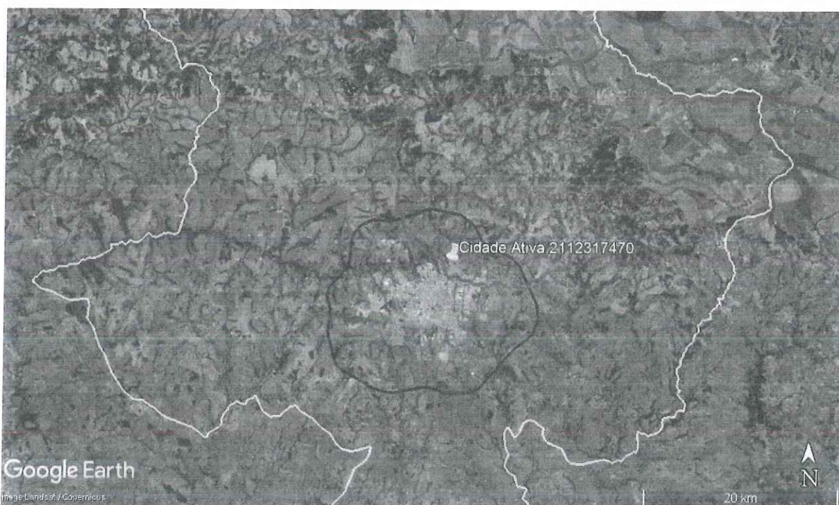
Figura 1 - Localização da árvore, marcador amarelo. Limite da APA do Rio Uberaba, delimitação em vermelho. Limite do perímetro urbano, delimitação em azul. E, por fim, limite do município de Uberaba/MG, delimitação em branco.

Atendendo a solicitação do documento supracitado, procedemos à vistoria do espécime localizado próximo a calçada em área verde pertencente à Prefeitura de Uberaba dentro da área de influência da APA do Rio Uberaba (figura 1).