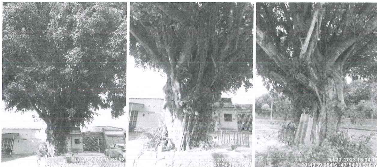
Figura 2 - Vista das figueiras comprometidas.

Diante disso, estes Técnicos recomendam o DEFERIMENTO do pedido. Para tanto, encaminhamos a solicitação para o Conselho Gestor da APA do Rio Uberaba para conhecimento e deliberação.