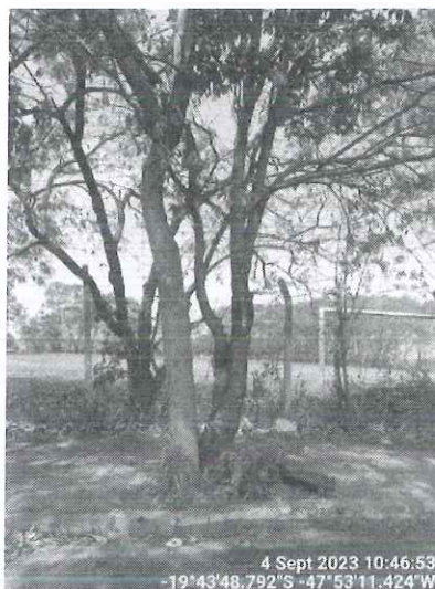
Figura 2 - Vista dos espécimes.