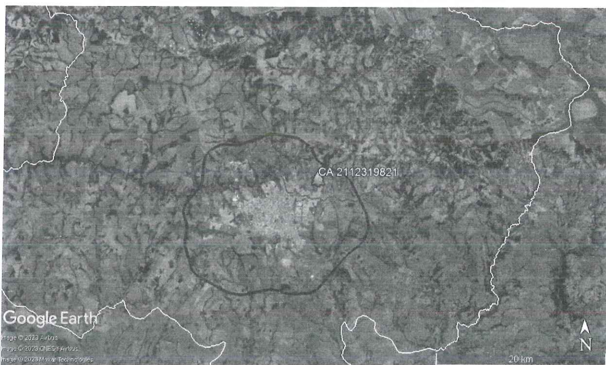
Figura 1 - Localização da árvore, marcador verde. Limite da APA do Rio Uberaba, delimitação em vermelho. Limite do perímetro urbano, delimitação em azul. E, por fim, limite do município de Uberaba/MG, delimitação em branco.

Atendendo a solicitação do documento supracitado, procedemos à vistoria do espécime localizado próximo a calçada em área verde pertencente à Prefeitura de Uberaba dentro da área de influência da APA do Rio Uberaba (figura 1).